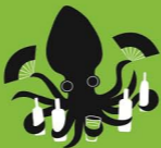
因暴飲酒アオリイカ