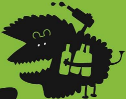
オオザケノマセウイオン