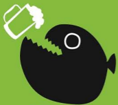
下院生嗜いピツニア