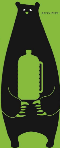
ヨイツツシ・グリスロー

いつものように飲んでいただけ、それも言います。 クラブの伝統だから、飲ませただけ。 飲酒の強要は、よくないが、そのしきたりは強要だとは思わなかった。 そうして、先輩のお酒を飲み干して、亡くなってしまった。 でも、飲んで当然、当たり前という状況は「飲酒の強要」です。 誰かが黙って止めていたら、死ななかったかもしれない。 無言の圧力、見て見ぬふりもアルコール・ハラスメント、 飲酒にまつわる人権侵害です。