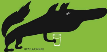
ゴクアクムホウオオカミ