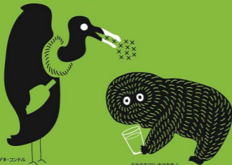
暴食トツギキ・コンドル