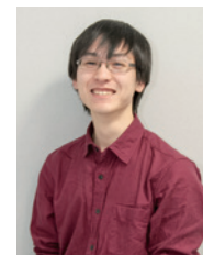
全国大学生協共済生活協同組合連合会 院生委員会 北海道大学 大学院 修士2年

学業、人間関係、健康など院生生活の 悩みや不安をサポートします (学生生活無料健康相談テレホン※共済加入者のみ)