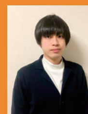
全国大学生生活協同組合連合会 院生委員会 京都大学 大学院 修士2年

学業、人間関係、健康など院生生活の 悩みや不安をサポートします 学生生活無料健康相談テレホン※共済加入者専用サービス